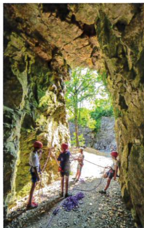
Entrée du site d'escalade

Cette ancienne carrière située sur Montmartin-sur-Mer a longtemps servi à l'extraction de pierres servant à la construction de maisons ou de fours à chaux. Au bout du chemin, on découvre ce lieu en forme de cirque devenu de nos jours un site naturel régional d'escalade. La roche atteint à certains endroits une hauteur de 15 mètres. L'association Horizon Vertical propose des initiations et des stages d'escalade dans ce magnifique cadre à partir des beaux jours.